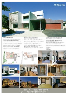
作品名：板橋の家 応募者：岩瀬 行泰 設計者：岩瀬アトリエ 建築設計事務所 施工者：中尾建設工業株