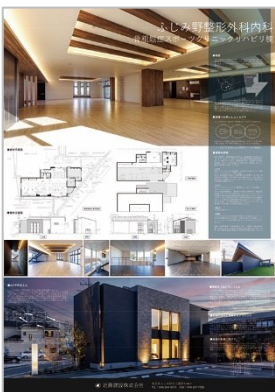
作品名：ふじみ野整形外科内科 骨粗鬆症スポーツクリニックリハビリ棟 応募者：宇佐見 佳之 設計者：近藤建設(株) 施工者：近藤建設(株)