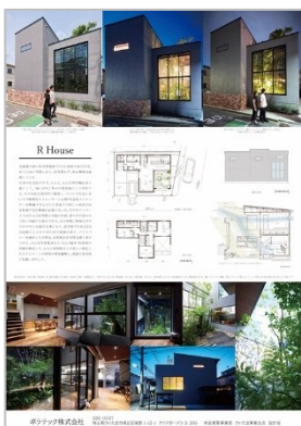
作品名：R House 応募者：ポラテック(株) 設計者：ポラテック(株) 施工者：ポラテック(株)