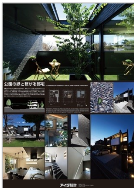
作品名：公園の緑と繋がる邸宅 応募者：會田 貞光 設計者：(株)アイダ設計 施工者：(株)アイダ設計