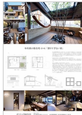
作品名：令和最小限住宅4×4 「造りすぎない家」 応募者：ポラテック(株) 設計者：ポラテック(株) 施工者：ポラテック(株)