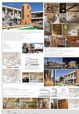
作品名：樹の塔の園舎 おさなご園 応募者：並木 秀浩 設計者：(株)ア・シード建築設計 (有)江尻建築構造設計事務所 施工者：中村建設(株)