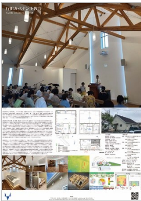
作品名：行田カベナント教会 応募者：荒木 牧人 設計者：maao 施工者：(有)門倉工務店