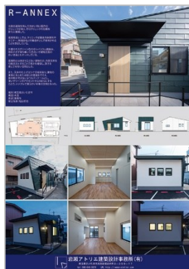
作品名：R-ANNEX 応募者：岩瀬 行泰 設計者：岩瀬アトリエ 建築設計事務所(有) 施工者：(有)千葉ハウジング